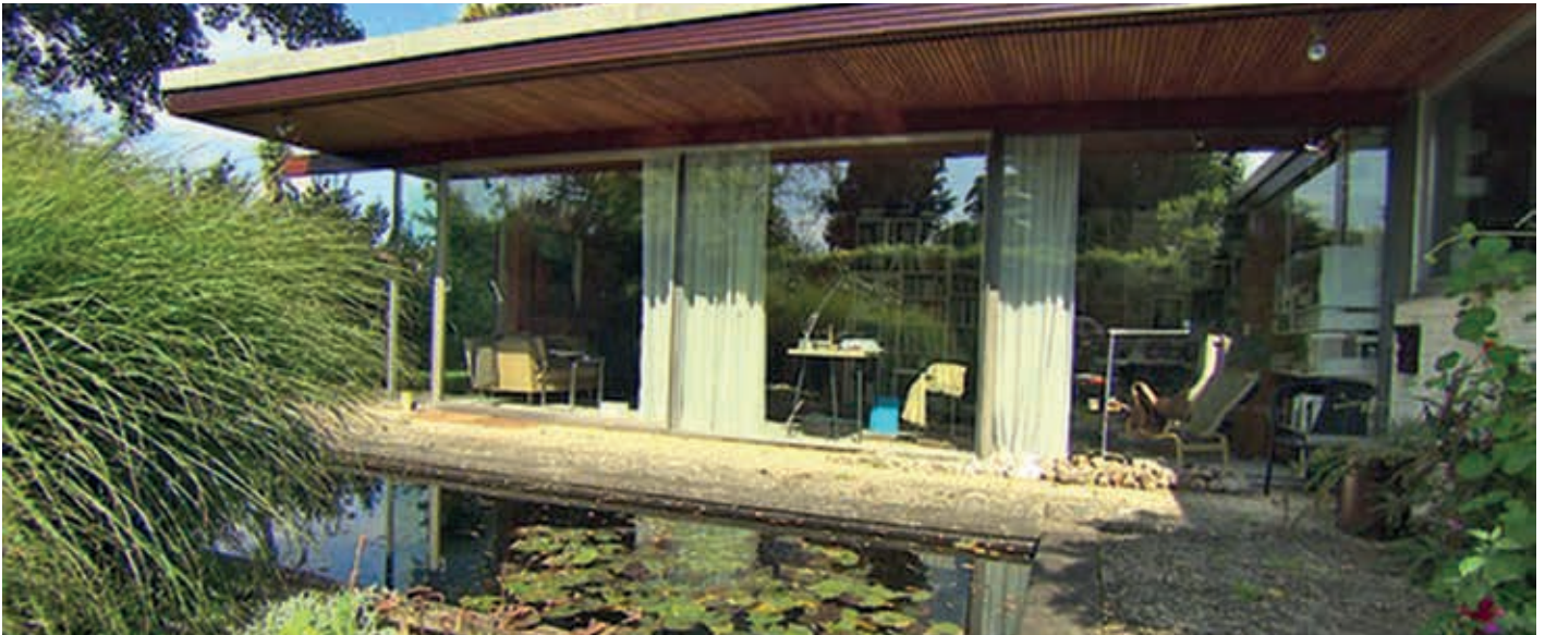
In den 1960er Jahren baute die BEWOBAU mit Richard Neutra auch eine Bungalowsiedlung in Quickborn

am Ende seiner Amtszeit auch für die alten „Gassenhäuser“ (Shikumen) begeisterte, die er in Shanghai sah und die für ihn in beispielhafter Weise eine nachbarschaftliche Gemeinschaft schufen.