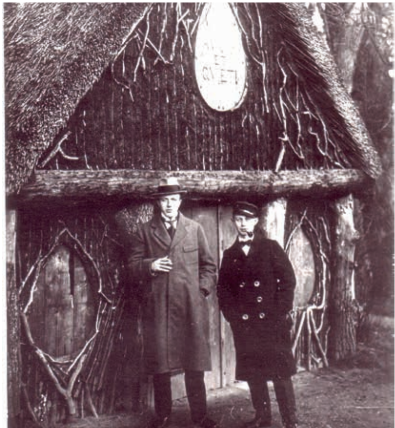
Die Eierhütte um 1920.