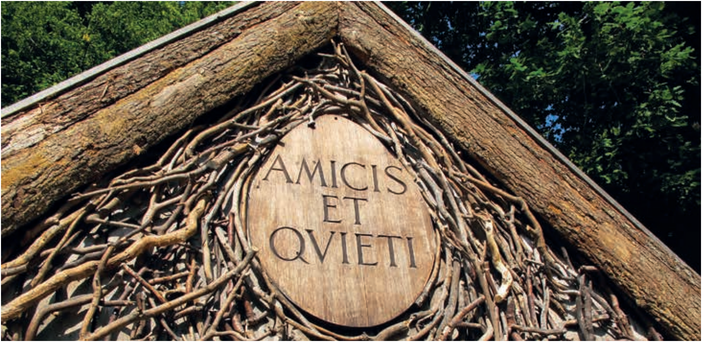
(C) Giebel nach der Sanierung 2021 Foto Schult