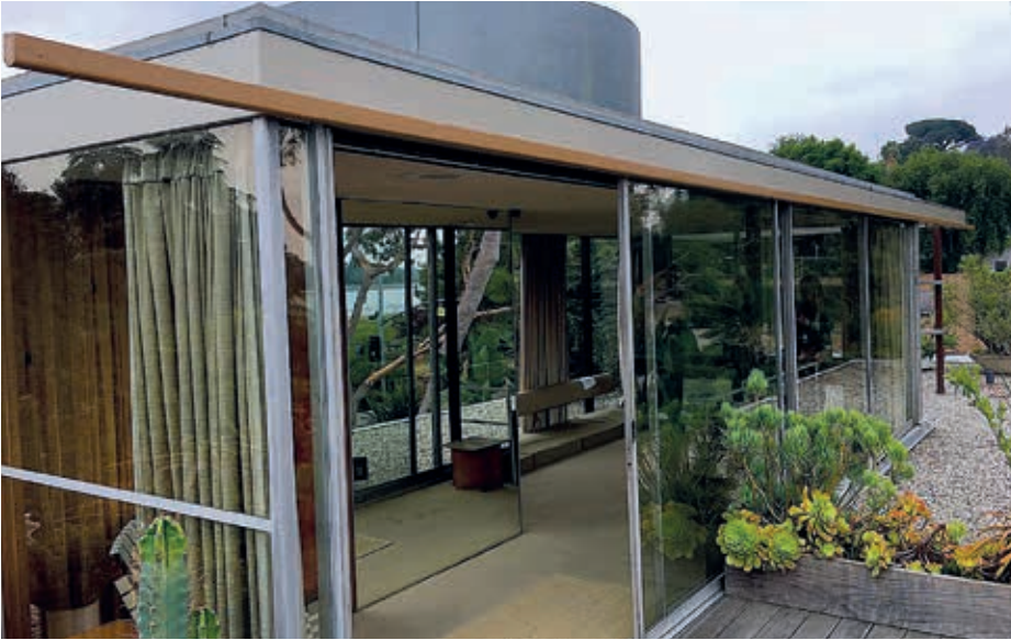
Der private Bungalow von Richard Neutra in Kalifornien aus den 1930er Jahren