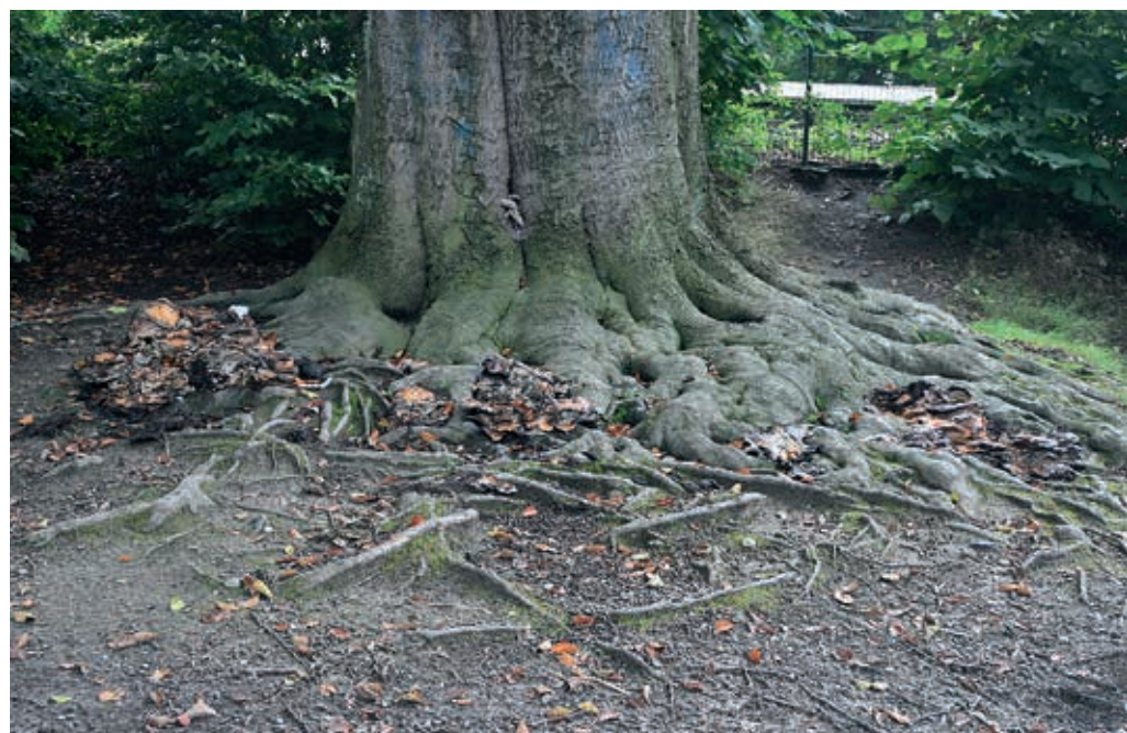
Pilzbefall mit Riesenporling ( Meripilus giganteus )

und an einer ebenfalls unser belebten Einkaufsstraße.